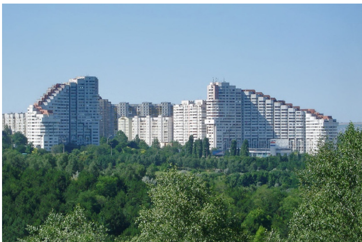
Nuevas edificaciones en Chisinau (capital)